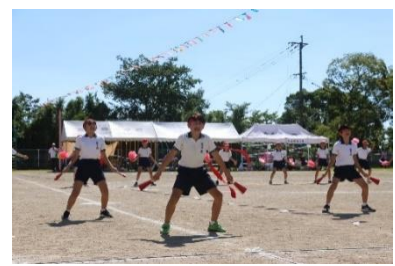
【熱のこもった応援団】