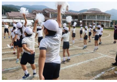
【全員で盛り上げる応援合戦】