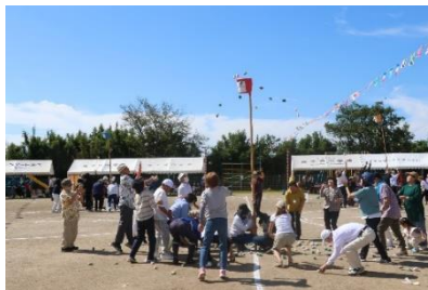
【地域種目も楽しく真剣に】