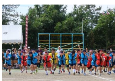
【下学年も上学年も全力で舞う】