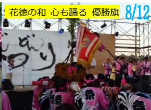
花徳の和 心も踊る 優勝旗