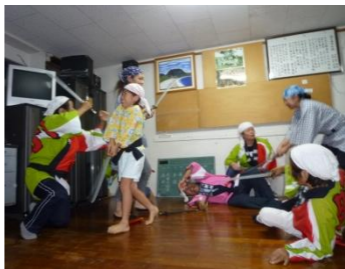
送別会 料理に出し物 頑張った 8/25