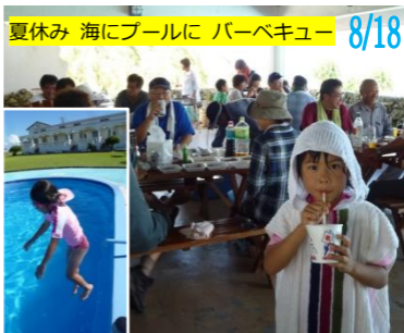
夏休み 海にプールに バーベキュー